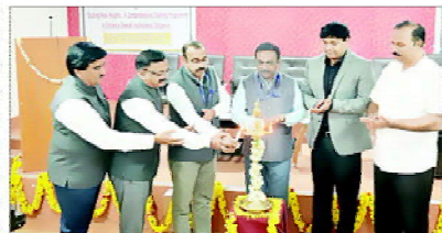
ಹಾಸನ ಮಲೆನಾಡು ತಾಂತ್ರಿಕ ಮಹಾವಿದ್ಯಾಲಯದ ಮೆಲ್ಬೋರ್ನ್ ಮತ್ತು ಸಿಎಲ್ ಎಂಜಿನಿಯರಿಂಗ್ ವಿಭಾಗಗಳ ವತಿಯಿಂದ ತರಬೇತಿ ಕಾರ್ಯಕ್ರಮದ ಕರಗುವಾಯಿತು.